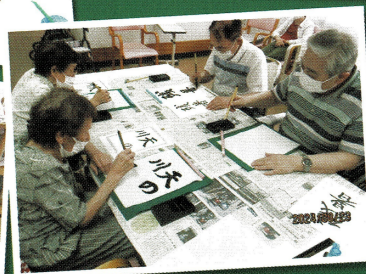
とっても真剣です